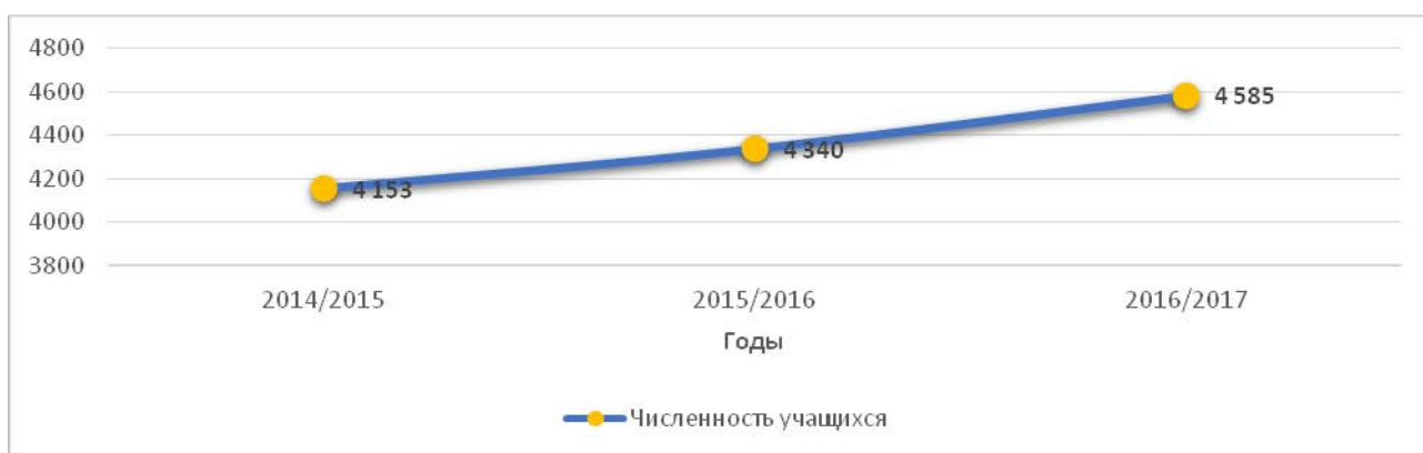
Рисунок 1 – Численность учащихся общеобразовательных организаций, чел.

На начало 2016/2017 учебного года численность учащихся общеобразовательных организаций, составляла 4 585 человек, что на 245 человек больше относительно 2015 года (рисунок 1). В процентном выражении прирост составил 105,65 %. Рост учащихся связан с большим выпуском воспитанников дошкольных образовательных организаций.