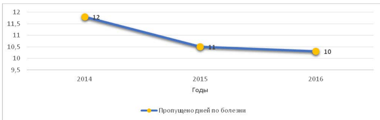
Рисунок 2 – Пропущено дней по болезни одним ребенком в год, дней

Количество дней, пропущенных по болезни одним ребенком в дошкольной образовательной организации, за 2016 год составило 10 дней, за 2015 год – 11 дней. Наблюдается положительная динамика по уменьшению заболеваемости (рисунок 2).